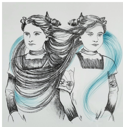
Corinne De Battista - "Double", 1/1, Lithographie sur papier, 38x47 cm, 2016