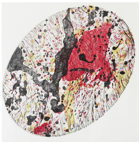
Nathalie Noé Adam - "ST (Stillstand bleu rouge jaune) (détail)", Monotype Linogravure, 54 x 54 cm, 2013

© Nathalie Noé Adam / Courtesy galerie Jean-Louis Ramand