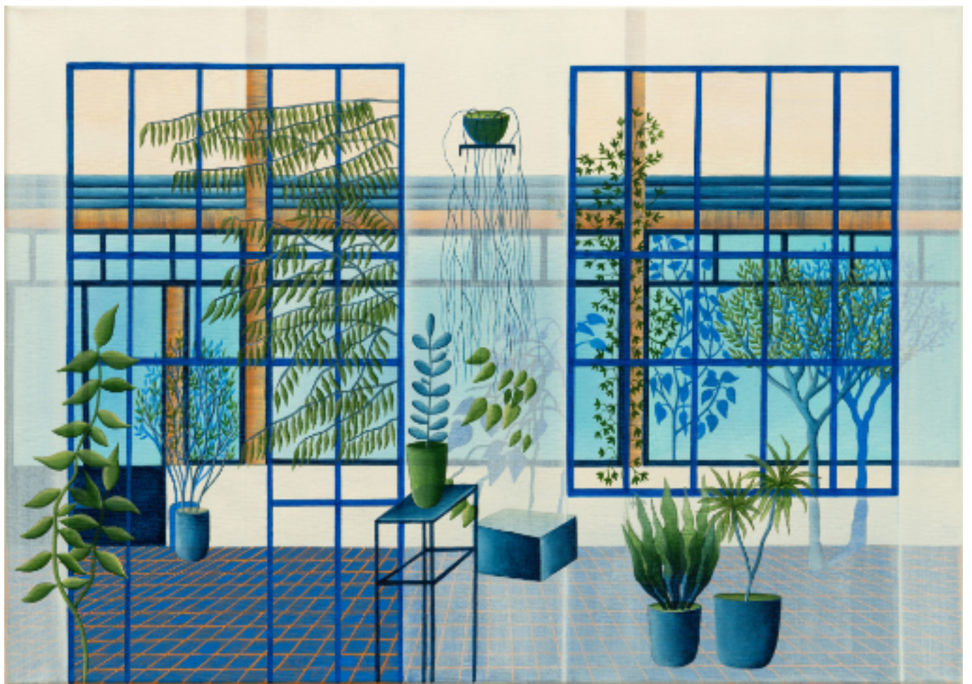
Villa du lavoir 70 X 50, acrylique et vinylique sur toile, 2021