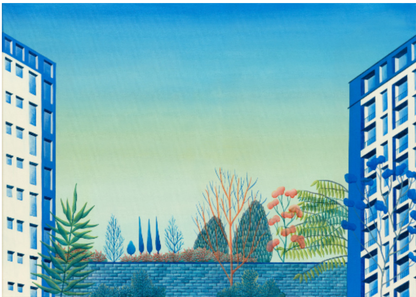
Small bricks, great expectations 70 X 50, acrylique et vinylique sur toile, 2022