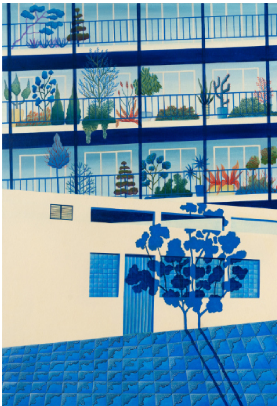
Candeur est furtive 89 X 130, acrylique et vinylique sur toile, 2022