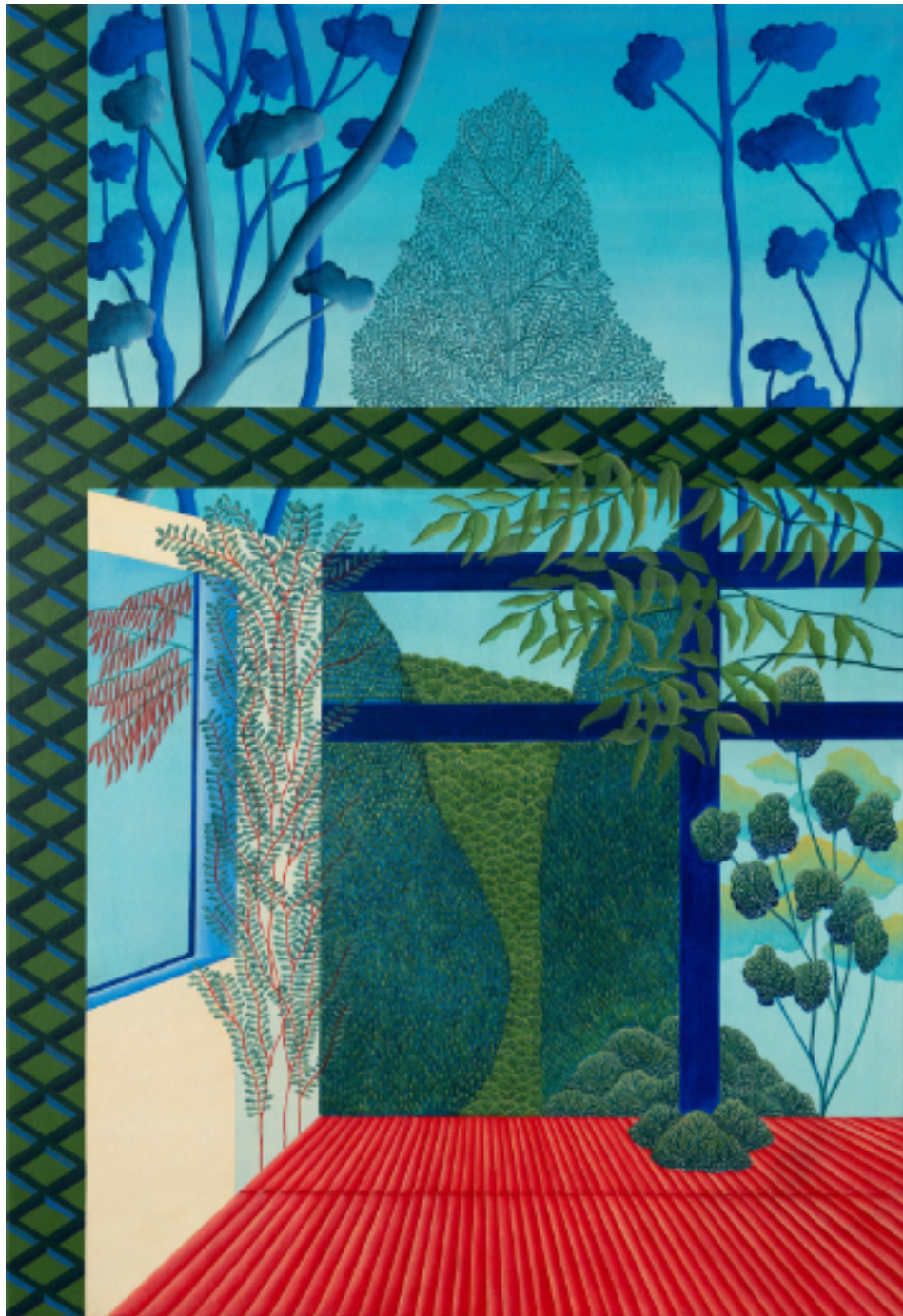
Le patio 89 x 130, acrylique et vinylique sur toile, 2021