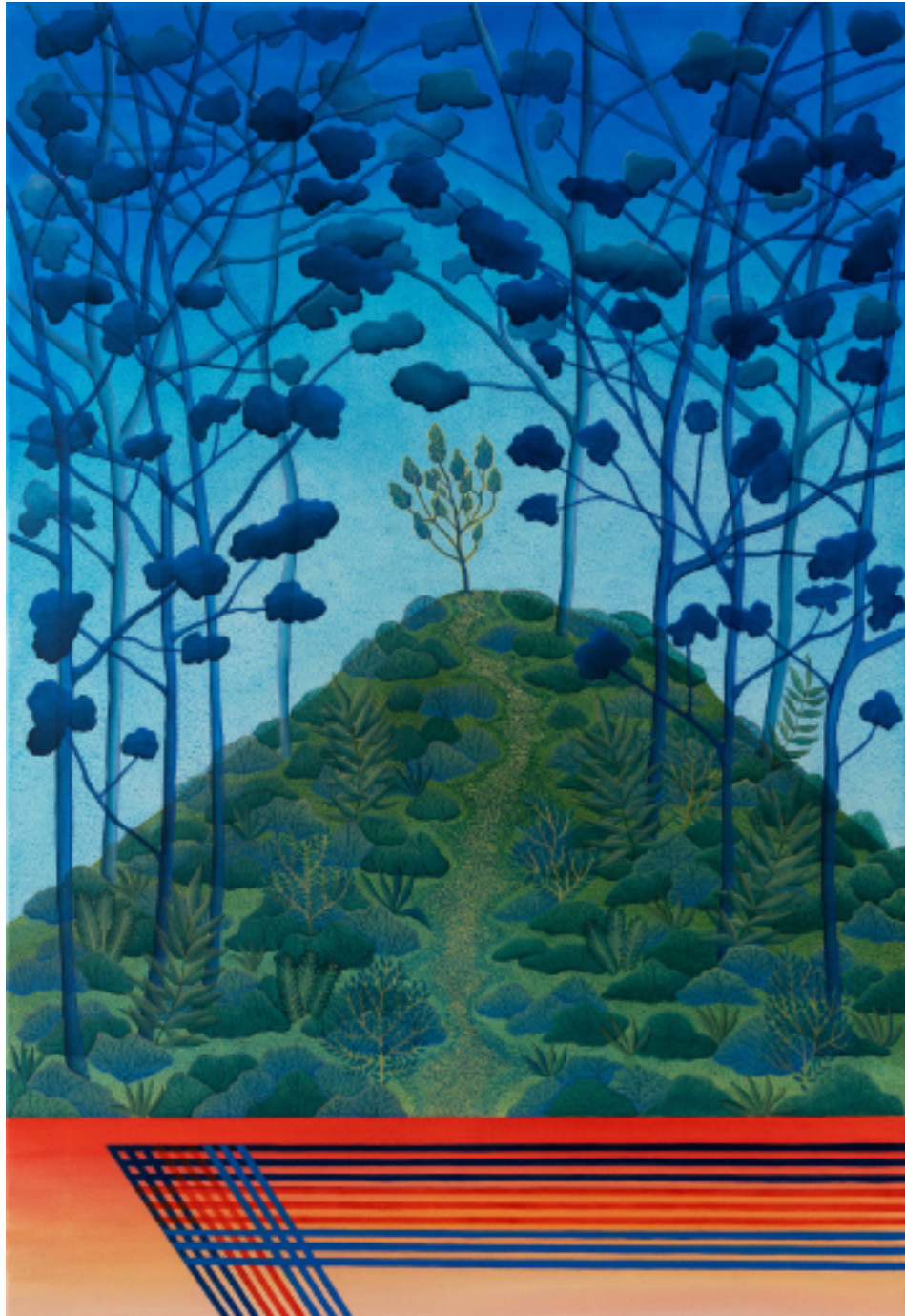
Arbuste dilettante sur le chemin du Cap 89 x 130, acrylique et vinylique sur toile, 2022