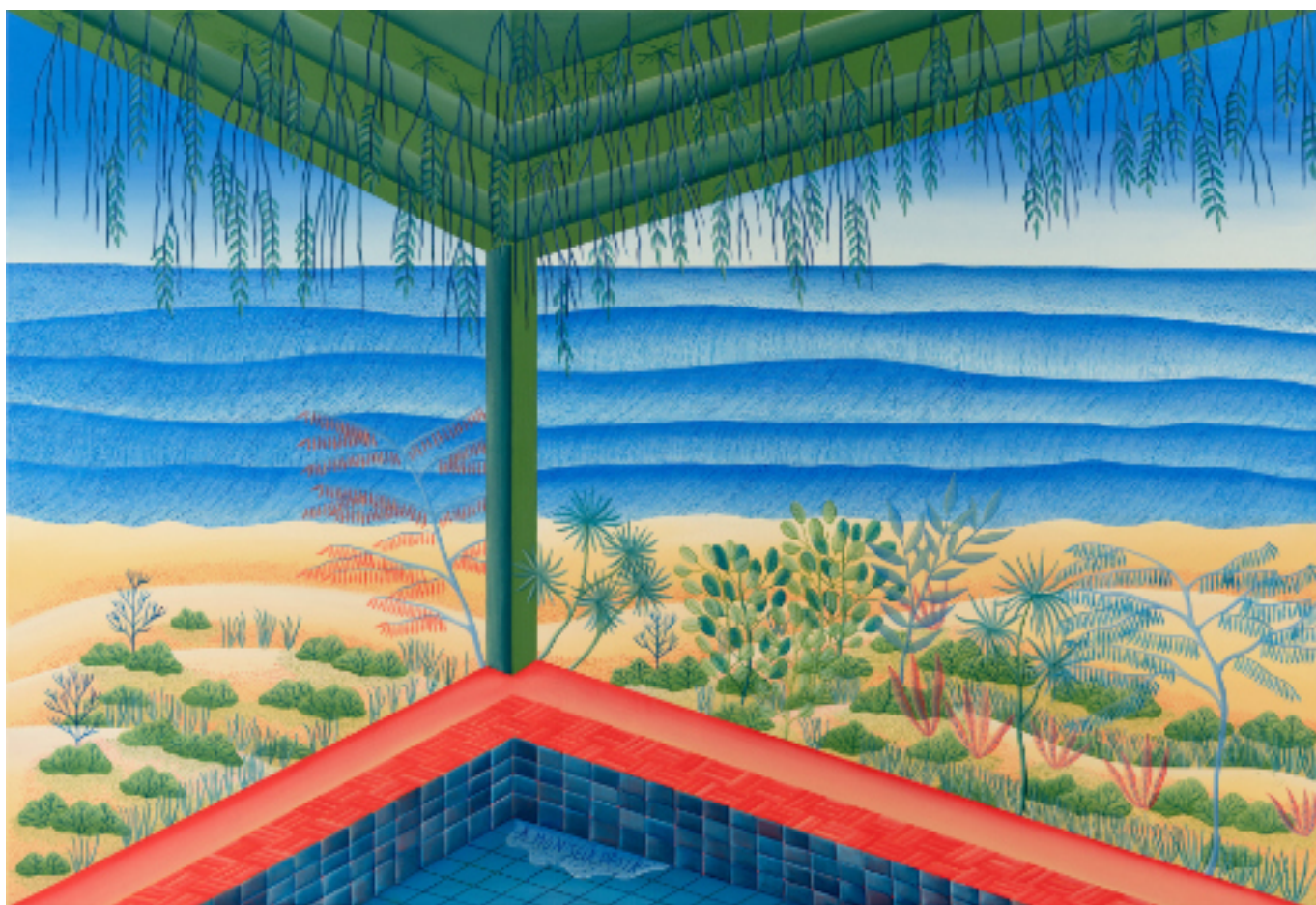
À mon seul désir 130 x 89, acrylique sur toile, 2022